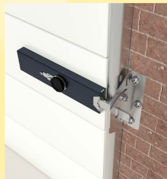
aanzicht binnen: montage hoekbeugel op geleide-rails is ook mogelijk