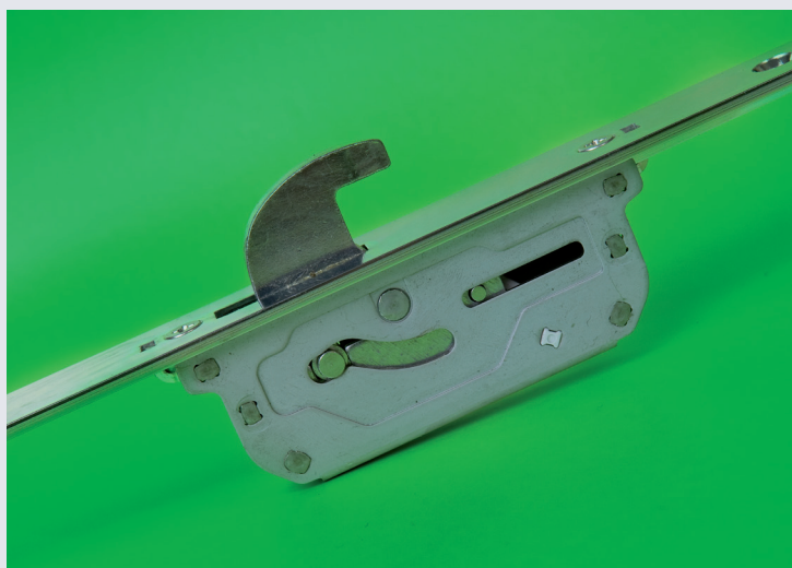
Afb. 1 Bovenste en onderste haak Renovatie MPS

Tevens is de hoofdkast verkrijgbaar met een Keso cilindergatsparing (art. nr. 500494).