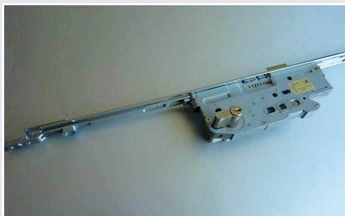
Afb. 4 Hoofdslotkast incl. schakeling