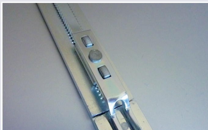
Afb. 6 Schakeling hoofdkast met eindkast