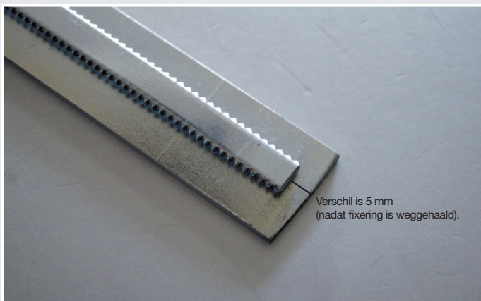
Afb. 5 Uiteinde einddeel op maat te maken