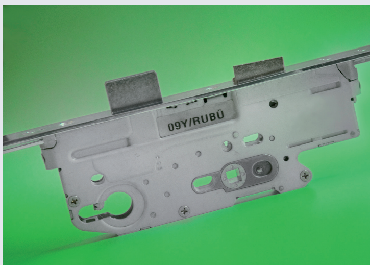
Afb. 2 Hoofdkast Renovatie MPS